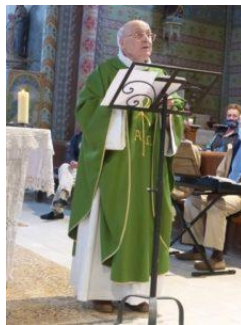
Eglise de Grenois le 26 juillet 2020