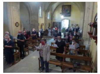
Eglise de Lys le 18 juillet 2020