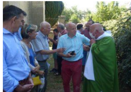
Eglise de Héry le 19 juillet 2020