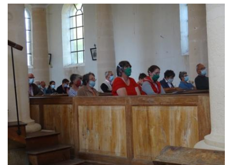
Eglise de Gacogne le 1 er août 2020