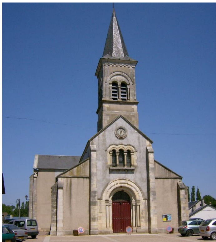
Chatillon en Bazois

Pastorale des collégiens Père Yves Sauvart Bénédicte Charrier pastorale.collegiens@nievre.catholique.fr 06 15 93 56 20